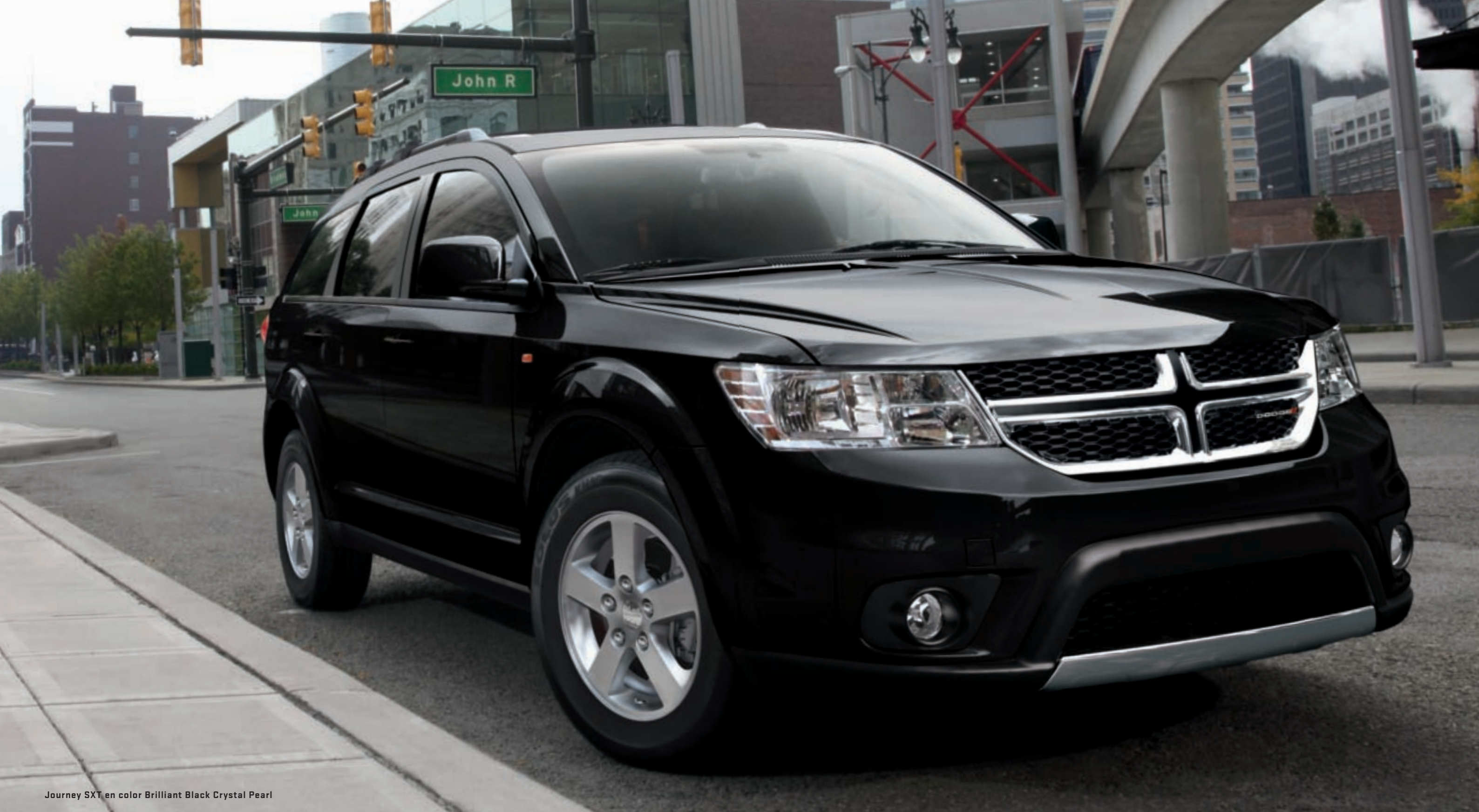
Journey SXT en color Brilliant Black Crystal Pearl

LISTO PARA TODO. Este es un vehículo de cinco puertas que sobre el pavimento proyecta una personalidad claramente reconocible por su inconfundible frente y su musculoso perfil. El Journey SXT se gana sus insignias en estilo y determinación con un equilibrio sólo comparable a lo amplio de su postura. Diseñado desde todos los ángulos, los modelos R/T exhiben llantas de 19 pulgadas en aluminio y tapabarros moldeados. Los espejos calefaccionados, pintados al color de la carrocería, así como la mascarilla y manillas brillantes, dan una pista de la potencia que trae el motor V6 de 206 kW y la tracción en las cuatro ruedas (disponible para el AWD). Al interior, asientos premium tapizados en cuero con costuras y una radio Media Center Uconnect Touch™ 8.4 –con gran pantalla touch de 8.4 pulgadas*, complacen a cualquiera que se suba. (*) Disponible según mercado y versión.