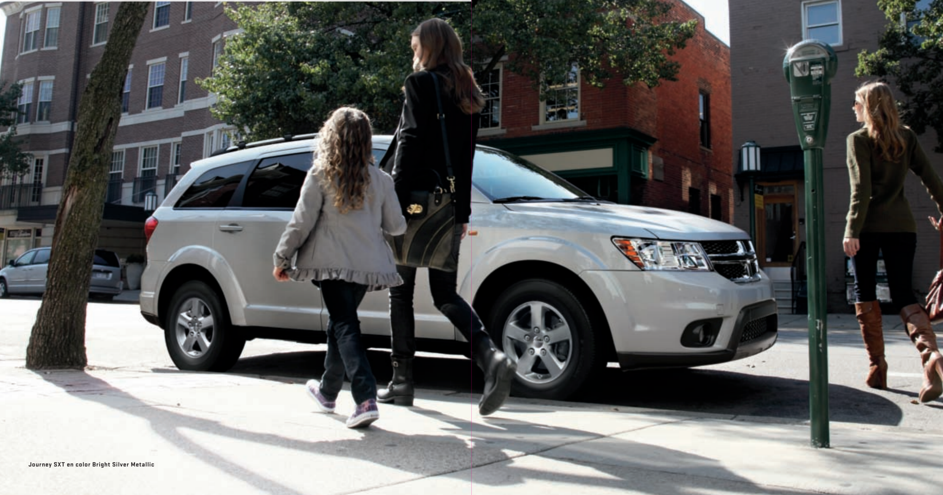
Journey SXT en color Bright Silver Metallic

DODGE JOURNEY. ESTE CROSSOVER DE TAMAÑO MEDIO ENCARNA UN SINGULAR EQUILIBRIO DE VERSATILIDAD, RENDIMIENTO Y SOFISTICACIÓN. ARMONIOSO Y BIEN PERFILADO, SE MUEVE POR LAS CALLES CON GRAN CONFIANZA. DE INCREÍBLE FLEXIBILIDAD, ACOGE A LAS PERSONAS Y TODAS SUS PERTENENCIAS CON EL MISMO GRADO DE ATENCIÓN. ESTO ES LO ÚLTIMO EN ENSAMBLE DE FORMA Y FUNCIÓN. ESTE ES EL DODGE JOURNEY.